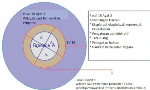
Gambar 1. Ilustrasi Pasal 18 (4) UU 32/2004